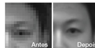
Técnicas de super-resolução desenvolvidas pela NEC podem produzir imagens de alta resolução e facilmente reconhecíveis a partir de fotos embaçadas.

De acordo com Imaoka, os resultados dos testes do NIST apontaram o sistema NeoFace encontrando correspondências de imagens em um banco de dados de 1,6 milhão de indivíduos, alcançando um grau de precisão infinitamente melhor do que os sistemas rivais (0,3 por cento de falsa rejeição, com 0,1 por cento de falsa aceitação) em menos de um terço de segundo, muitas vezes mais rápido do que o seu concorrente mais próximo.